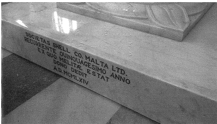
Ritratt tal-battisteru fil-post prezenti tiegħu

L-istil ta' dan il-battisteru jikkumplimenta hafna mal-istil tal-artal magġur. Jikkonsisti minn kolonna baxxa li magħha nsibu skolpiti s-simboli tal-erba' evangelisti, u fuqha jserrah il-fonti nnifsu li minn ġewwa hu maqsum f'żewġ partijiet, il-parti fejn jinżamm l-ilma mbierek, u l-parti fejn l-imghammed jiġi mnixxef mill-ilma li jkun għadu kemm tghammed bih. Dan il-battisteru hu mzejjen b'xogħol mill-iktar fin ta' skultura ornamenti f'irham flimkien ma' mużajċi ta' lewn dehbi li jagħti dehra iktar majestuza lil dan il-battisteru. Ta' interess kbir hu l-atu tal-bronż li għandu forma ta' arzella. Din mhix xi kumbinazzjoni, imma dan l-għatu jekk tarah minn fuq għandu l-forma eżatta tal- logo tal-kumpanija Shell bħala tifikira dejjiema tagħha f'Birżebbuġa.