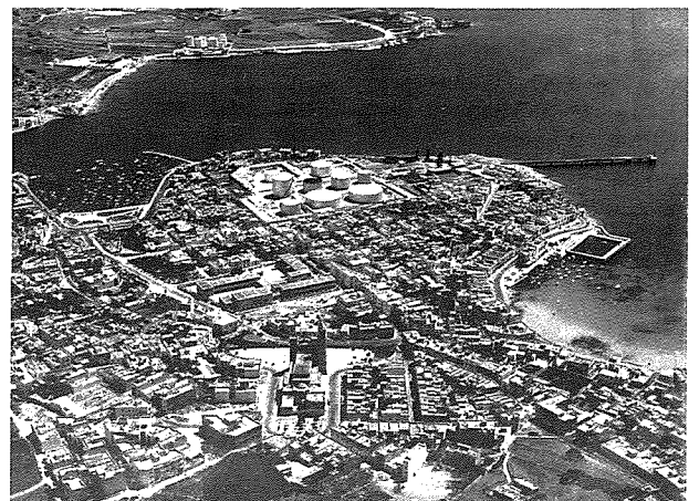
L-impjant tas-Shell meta kien lest