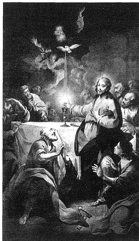
fil-Bażilika Sant'Elena B'kara