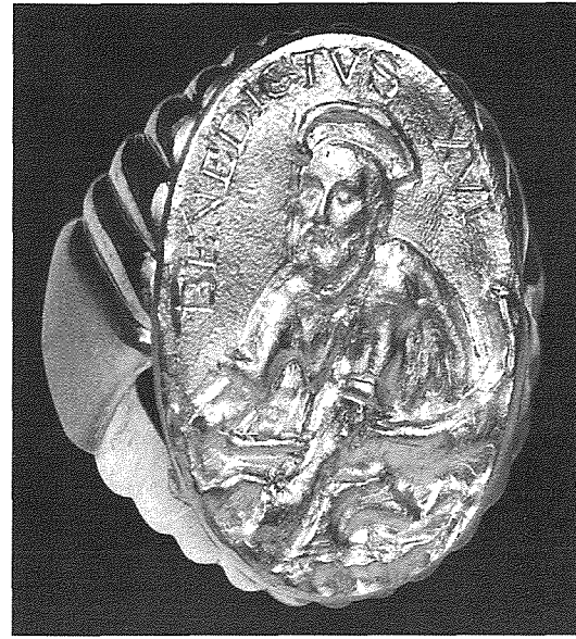
Ċurkett tal-Papa Benedittu XVI

Dan huwa ċ-ċurkett li jilbes il-Papa u jissejjah bil-latin 'annulus piscatoris' jew 'iċ-ċurkett tas-sajjied' u dan għal San Pietru li kien sajjied fil-baħar tal-Galilleja u wkoll sajjied tal-bnedmin. Infatti ċ-ċurkett tal-Papa Frangisku fih l-immagna ta' San Pietru Papa biċ-ċwieviet f'idejh. Tal-Papa Benedittu XVI kien bl-immagna ta' San Pietru bħala sajjied jitfa' x-xibka għall-hut (ara Luqa 5:1-11). Dan iċ-ċurkett juri fuq kollox l-awtorità tal-Papa u l-imhabba tiegħu lejn il-Knisja Universali. Proprjament iċ-ċurkett tal-Papa Frangisku kien magħmul mill-iskultur Enrico Manfrini għal Papa l-Beatu Pawlu VI imma dan qatt ma gie rrealizzat fil-metall għaliex Pawlu VI kien libes iċ-ċurkett marbut mal-Konċilju Vatikan II. Manfrini miet fl-2004 u kien ha-dem ogġetti reliġjużi għal Papa Piju XII, Pawlu VI u għal San Ġwanni Pawlu II. Il-forma taċ-ċurkett ta' Manfrini għaddiet l-ewwel għand is-segretarju ta' Pawlu VI, Mons. Arcisqof Pasquale Macchi, imbagħad għal għand Mons. Ettore Malnati kappillan tal-Parroċċa 'Nostra Signora della Provvidenza e di Sion' fi Trieste. Fl-2007 xi zingari daħlu jisirqu f'din il-parroċċa imma dan iċ-ċurkett baqa' bla mittiefes. Dan iċ-ċurkett huwa tal-fidda.