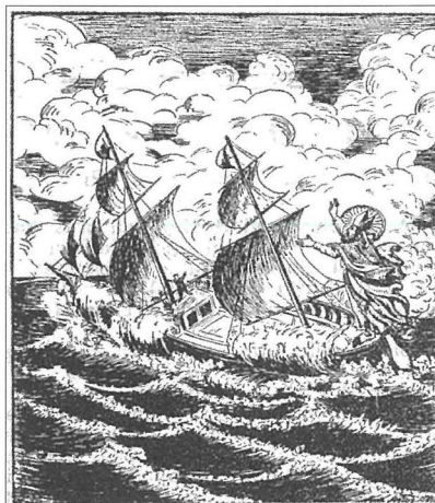
.... in-nies tal-équipaġġ chif waslu Malta irraccontaw li ma tul it-tempesta chienju jaraw lill S. Publiu imexxi il bastiment tagħhom.