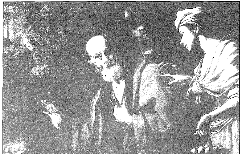
Ič-Ċaħda ta' San Pietru li jinsab fil-mużew tal-Arti fil-Belt Valletta