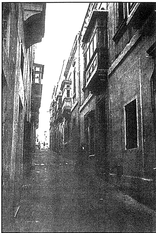
96, Strada Buongiorno, Cospicua

Billi l-bini kien go xulxin, il-hsejjes u ghajjat tal-ġirien ġieli kien itellef kemm lill-ghalliema kif ukoll lill-istudenti. Izda, dik il-habta, ma setghux jaghmlu mod iehor. 7