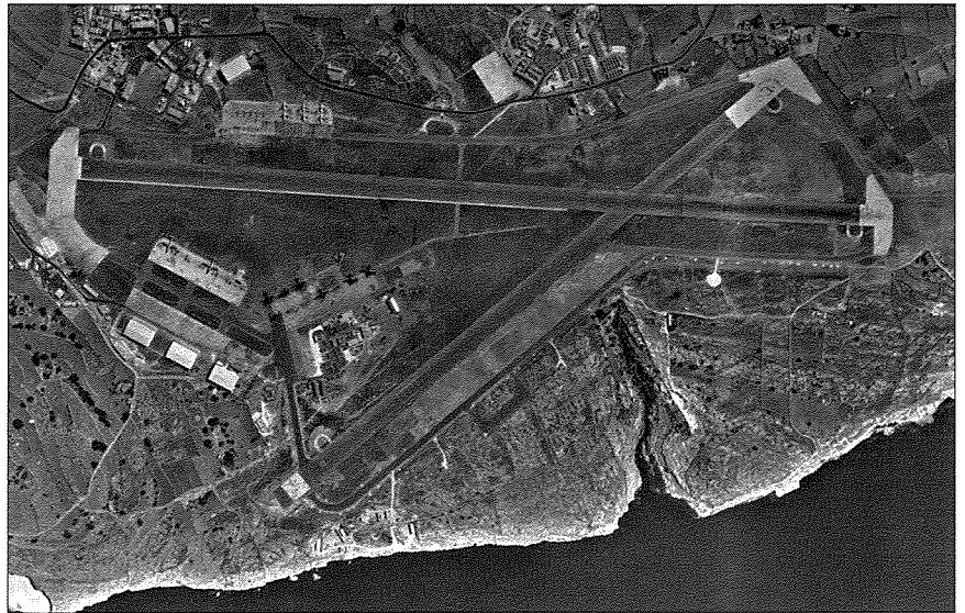
Il-mitjar ta' Hal Far

I t-tmiem tal-ewwel Gwerra Dinija fis-sena 1919 gābet tnaqqis f'Kalafrana. Is-seaplane carriers irritornaw lejn l-Ingilterra u hallew biss HMS Engadine fil-Mediterran. L-isquadron 268 giet żarmata f' Ottubru ta-1919 imma N° 267 baqgħet sa Awwissu 1923. Għalkemm l-FAA saret ufiċjalment parti mill-RAF fl-1924, u fiż- żmien bejn iż-żewg gwerer diniji nghatat fit importanza lill-bżonnijiet speċjal tal-avjazzjoni. Fl-1920 HMS Ark Royal halliet HMS Engadine għal perjodu qasir kif ukoll l-HMS Pegasus, li kien qed jahdem fil-Baltiku, irritornaw Malta għar-rebbiegħa u xhur tas-sajf, iżda ffit sar titjir f'dik is-sena u dik ta' warajha.