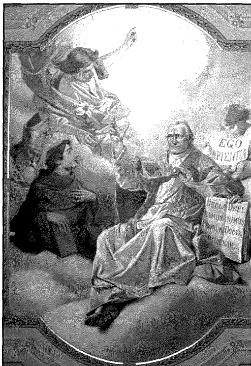
Il-Papa Piju IX, pittura ta' Ġuzeppi Cali fl-awla kapitulari ta' Bormla.

Nhar il-Hadd, 3 ta' Settembru, 2000, il-Q.T. il-Papa Ġwanni Pawlu II ibbeatifika lill-Papa Piju IX (Piju Nonu) u lill-Papa Ġwanni XXIII. Ghalina f'Bormla l-beatifikazzjoni ta' Piju IX qanqlet memorji sbieh, ghalix kien hu li fit-8 ta' Diċembru, 1854, iddefinixxa d- Domma tat-Tnissil bla Tebġha tal-Verġni Marija . Izda kemm hawn min jaf li, biss erba' snin qabel, dan l-istess Papa ghal daqsxejn m'ghaddiex sena u nofs shah hawn Malta, proprju fiz-żmien meta hu kien qiegħed jipprepara sewwa ghal din id-definizzjoni? Mhux hekk biss. Kien se jkun f'Malta fl-istess sena meta żejjen lill-Kapitlu ta' Bormla b'hafna privileġġi. Tghid il-Kapitlu ma kienx jistiednu jagħti titwila lill-unika knisja parrokkjali f'Malta dedikata dak iż-żmien lil Marija Immakulata? Naraw x'gara.