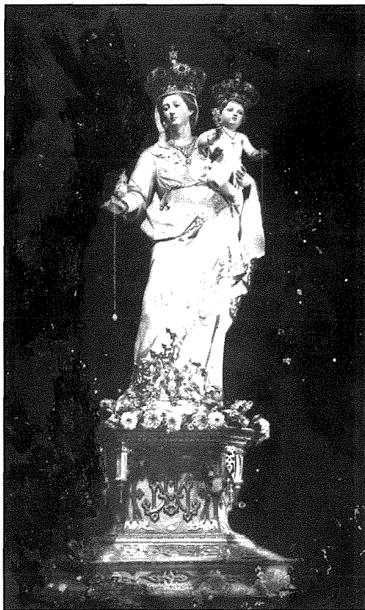
L-istatwa tal-Madonna, ta' Pawlu Azzopardi fl-1828, tal-Fratellanza tar-Rużarju li twaqqfet fl-1602.

Fl-1602 hemm irregistrati tmient imwiet, tnejn u sittin magħmudija u