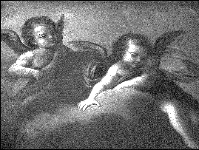
Il-puttini, dettal, Rocco Buhagiar, San Leonardu żejt fuq tila, 1751, Parroċċa ta' San Leonardu, Kirkop.