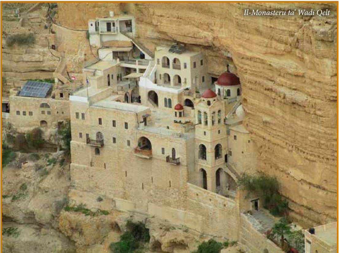
Il-Monasteru ta' Wadi Qelt

It-triq imbagħad titla' lejn għolja kollha blat hamrani li