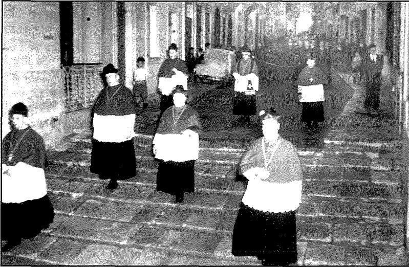
Funeral fi Triq Oratorju.

f'idejh, għadd ta' tfal tnejn, tnejn bil-fanali f'idejhom, u hafna rġiel wara l-qassis jghidu r-Rużarju. Xita jew bnazzi, bil-lejl jew filghodu, il-Vjatzku kien johroġ xorta, iżda meta tkun ix-xita s-sacerdot ikun fuq is- suġġetta merfugh minn erba' rġiel. Is- suġġetta għadha tinsab fl-Awla tal-Kapitlu tal-Kollegġjata taghna.