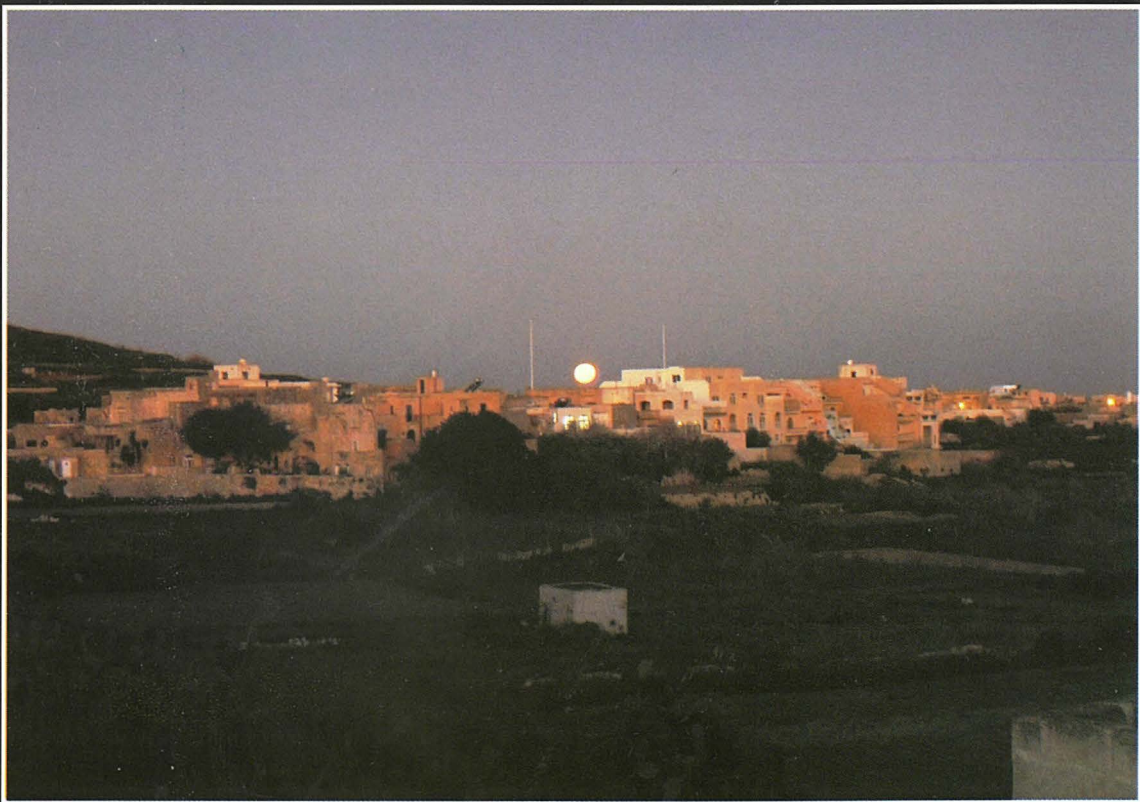
L-Għasri fl-għabex (2009)