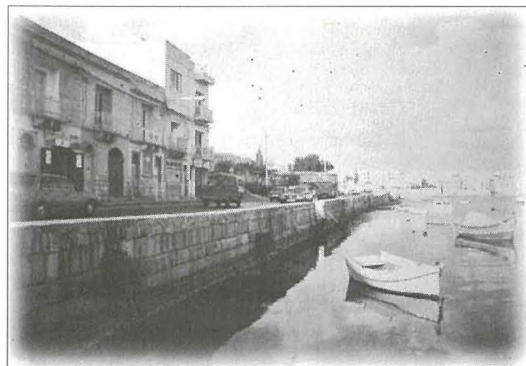
Ix-xatt ta' San Ġorġ f'Birżebbuġa minfejn giet imtella' ir-ras mill-Babar