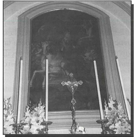
Il-Kwadru ta' San Ġorġ Martri fil-knisja ta' Ssan Ġorġ. Dan il-kwadru hu kopja ta' iehor impitter minn Mattia Preti li jinsab fil-Kon-Katidral ta' San Ġwann, il-Belt.