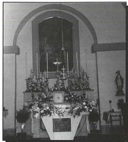
Il-Knisja ta' San Ġorġ minn ġewwa.

Il-knisja ta' San Ġorġ f'Birzebbuga tibqa' monument haj għan-Nobbli Girgor Bonici, l-benefattur kbir tal-Knisja Maltija fis-seklu XVII. Innofsinhar ta' Malta hu miżgħud b'kappelli u palazzi mibnija matul is-snin mill-Familja Testaferrata Bonici. Fi żmien meta din in-naha ta' Birzebbuga kienet għadha parti mill-parroċċa ta' Santa Katarina fiż-Żejtun, xejn ma wiehed jistagħġeb li kien hemm din ir-rabta intima bejn dan ir-rahal marittimu u wahda mill-eqdem parroċċi ta' Malta.