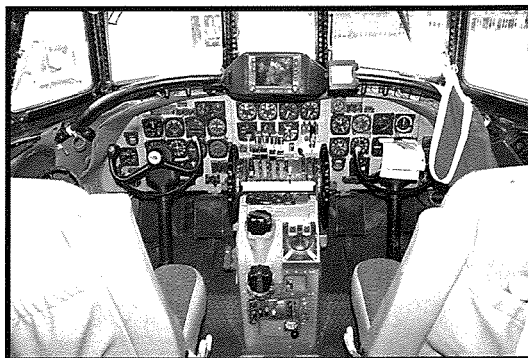
Il-cockpit tas- Super Constellation .