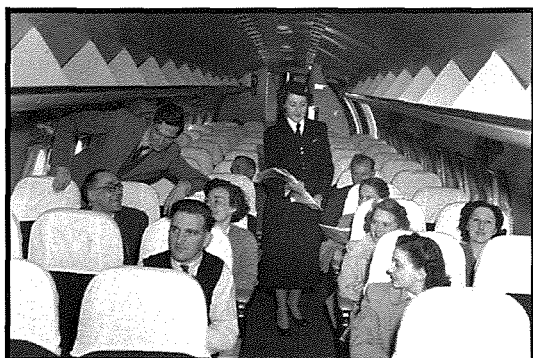
Il-kabina bil-passiġġieri waqt titjira tas-Super Constellation

Is-Super Constellation inbena mill-kumpanija Amerikana Lockheed bejn l-1943 u l-1958 fil-fabbriki tagħhom ġo Kalifornja. Inbnew 856 minnhom f'diversi mudelli differenti imma kollha tagħrafhom b'denbhom bi tlieta u żaqqhom forma ta' delfin. Kienu jintużaw kemm bħala ajruplani ċivili u wkoll għall-militar. Fil-fatt wieħed minnhom kien jintuża bħala l-ajruplan presidenzjali tal-President Amerika Dwight D. Eisenhower. Il-Constellation jew kif jissejjaħ "Connie" jaħdem b'erba' magni bl-iskrejjen bi tmintax-il ċilindru l-waħda (radial Wright R-3350 3250hp). Dawn il-magni kellhom qawwa kbira u l-ajruplan kien kapaċi jtellja veloċità massima ta' 550 kilometru fis-siegħa u jitla' għoli ta' 7300 metri (24000 pied). Wara t-tieni gwerra il-kumpanija Amerika TWA bdiet tuża l-Constellation bħala ajruplan ċivili biex taqşam l-Atlantiku mill-Amerka għall-Ewropa. Dan is-servizz tal-ajru beda fis-6 ta' Frar 1946 b'titjira minn New York sa Pariġi. Il-Constellation kien jgħabbi minn 62 sa 95 passiġġier u jieħu tgħabija ta' kwazi 30 tunellata. Il-kabina tal-Constellation kienet presurezzata u għalhekk il-passiġġieri kienu jkunu komdi matul it-titjira kollha bħal fl-ajruplani moderni tal-lum. Ħafna iktar kumpaniji tal-ajru daħlu l-Constellation fil-flotta tagħhom bħal Pan American World Airways, Air France, KLM, Qantas, Lufthansa, Air Canada u oħrajn. Però rridu ngħidu li malli ġew żviluppat l-ajruplani jets bħal Comet u l-Boeing 707