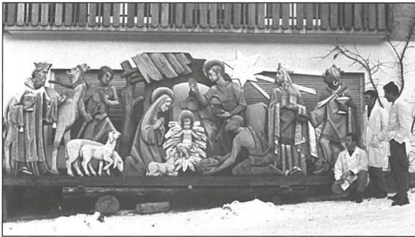
In-Natività għal Basta Umbra, maħduma fl-1969