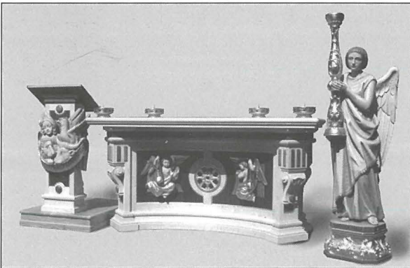
Altar, ambone u anġlu għal Knisja ta' San Vito dei Normanni, maħdumin fl-1987

personaġġi ta' fuq il-mensoli. Din l-aħħar rimarka fil-fatt titfa' dubju żgħir dwar jekk dawn il-figuri kinux fid-disinn oriġinali jew inkella ġewx miżjuda fuq inizjattiva ta' Xuereb. Il-prezz miftiehem għal dan il-pedestall kien ta' 492, 000 Lire taljani li minnhom tħallsu 34, 200 bħala kapparra fil-15 ta' Frar 1964, u pagament ieħor ta' 173, 000 Lire fl-20 ta' Lulju, biex sa dakinhar kien għad fadal jithallsu 284, 800 Lire . Minn kalkoli ta' malajr jidher li dan il-pedestall sewa madwar 110 Liri Maltin li għal dak iż-żmien kienet spiża sostanzjali. Il-pedestall intbagħat Malta fis-27 ta' Lulju 1964 f'kaxxa immarkata FP.723 b'qisien ta' 150x150x100cm, b'piż ta' 257 kilogrammi. F'Malta l-pedestall wasal Hal Kirkop u nżamm fil-Knisja Parrokkjali, fejn illum