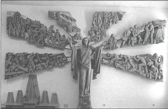
Prospettiva bi Kristu Rxoxt maħduma għal San Ninfa, maħduma fl-1986