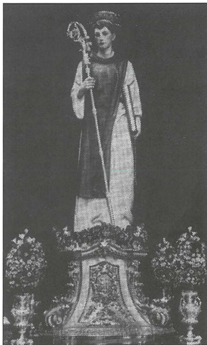
L-istatwa ta' San Leonardu maħduma mid-ditta Ferdinando Stuflesser (1949) fuq l-istess pedestall