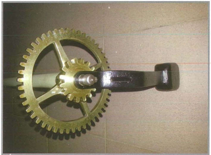
Parti mill-arloġġ wara r-restawr

Ix-xogħol beda maż-żarmar tal-bini tal-kampnar, iżda meta tlesta l-bini seta' jibda x-xogħol sew minħabba li qabel ma tehel il-magna kellhom isiru xogħlijiet fil-kamra tal-arloġġ biex ikun protett. Fosthom, inbidel saqaf tal-injam li tmermer biż-żmien u x-xita. Twaħħal sellum permanenti mal-ħajt biex ikun hemm aċċess iktar faċli għall-parti ta' fuq tal-kampnar fejn hemm l-imrieta u l-qniepen tal-arloġġ. Issewwa l-injam tal-istruttura twila minn fejn jgħaddu l-mažżri. Kollox inżebagħ b'żebgħa protettiva għal kontra