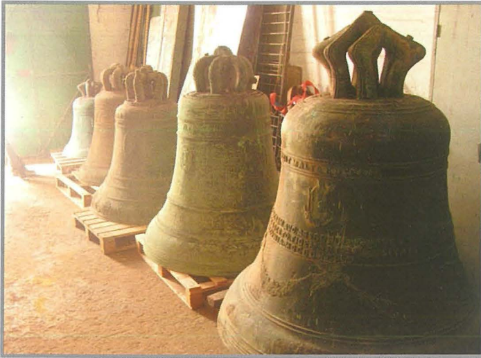
Uhud mill-qniepen fl-Inginerija

mill-widnejn tal-kuruna kellha tinbidel ukoll b'rizultat li l-qniepen kellhom jittaqqbu minn rashom biex il-piż jiġi ttrasferit mill-kuruna għal fuq il-widnejn. Ma' din il-bidla kellhom jinbidlu wkoll it-travi għal square bars solidi biex ix-xogħol jintrabat magħhom mingħajr ma jkun hemm tbandil ta' qniepen waqt id-daqq.