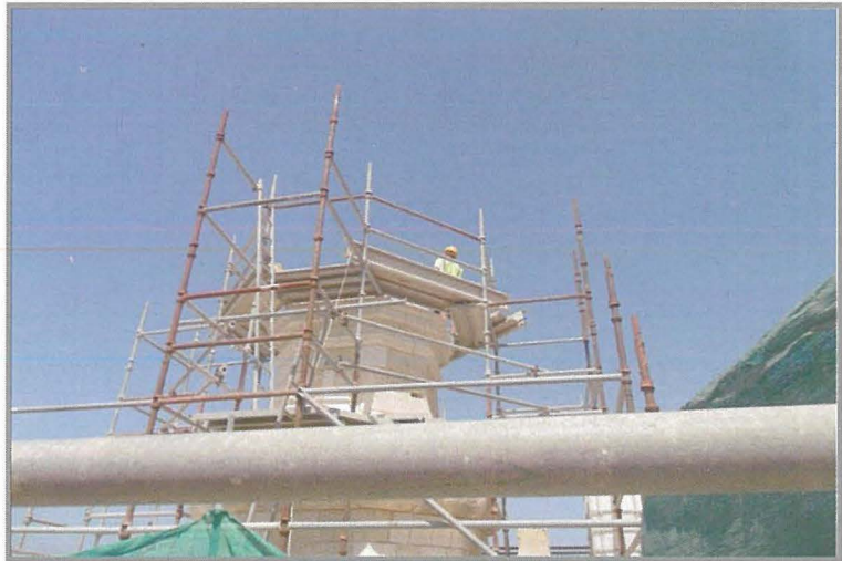
Il-cupside waqt li kienet qiegħda terġa' tintrama

Mill-kampnar, li x-xogħol fuqu beda f'Jannar 2016, inħattet il-parti ta' fuq tiegħu, jew il-cupside. Din il-parti