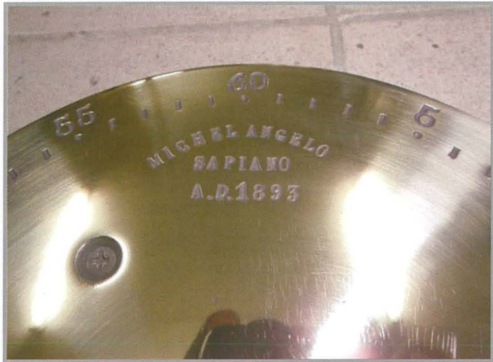
Il-kwadrant li juri il-ħin fuq ġewwa tal-arloġġ lanqas baqa jinqara sew minħabba li swied. Meta tnaddaf ġie mikxuf li hu magħmul tal-bronz u reġġhu ġew jidhru n-numri u l-isem: Michel Angelo Sapiano A.D. 1893

Interessanti ta' min isemmi li waqt li l-ħaddiema kienu qegħdin jirrangaw il-ġebbla,