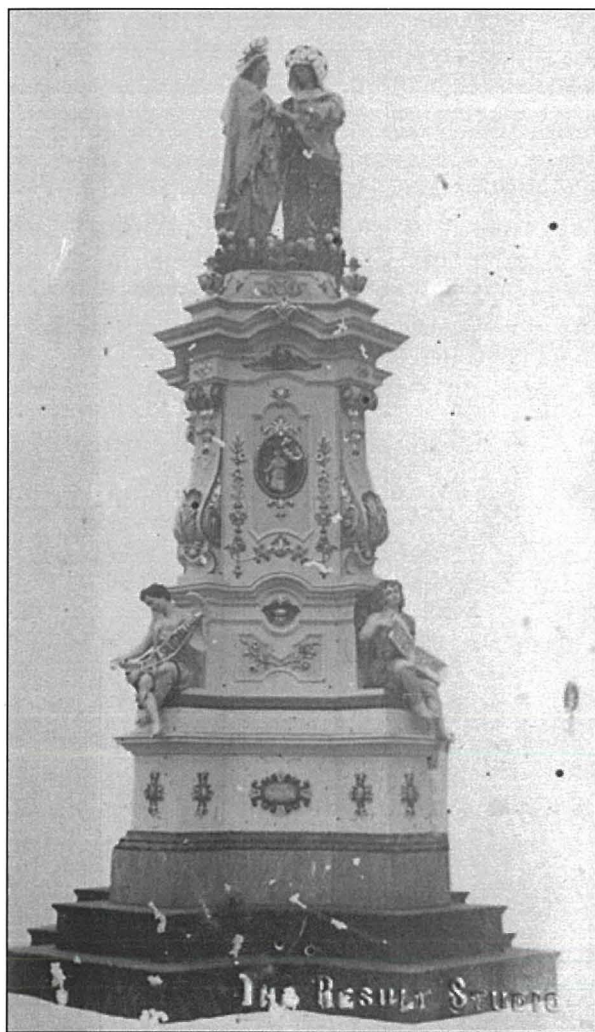
Figura 2. Il-Pedestall inħadem minn Karmenu Attard fuq disinn t'Abraham Gatt

Il-prokuratur ta' warajh kien Dun Piju Portelli li kompla jżid it-tiżjin tal-festa. Mal-ħatra tiegħu twaqqaf kumitat tal-festa. Dawn kienu jithabtu ħafna biex jiġbru l-flus għall-festa. Kienu jqassmu l-fieles fid-djar darbtejn fis-sena u mbagħad ibiġġuhom meta jsiru sriedaq, jiġbru l-prodotti tar-raba għall-bejgħ u jorganizzaw lotteriji. Kienu jarmaw statwi fuqil-pedestalli, antarjoli, pavaljuni, kolonni, piramidi u trofej. Fl-1929 għamlu kampanja kbira ta' ġbir għall-pedestall tal-istatwa tal-Viżitazzjoni. Dan il-pedestall (Figuri 2,3 u 4) inħadem mill-imġhallem Karmenu Attard, imlaqqam 'L-Għammiel', mill-Belt Vittorja fuq id-disinn t'Abraham Gatt minn Bormla. L-iskultura tal-injam inħadmet mill-imġhallem Sant ta' Birkirkara.