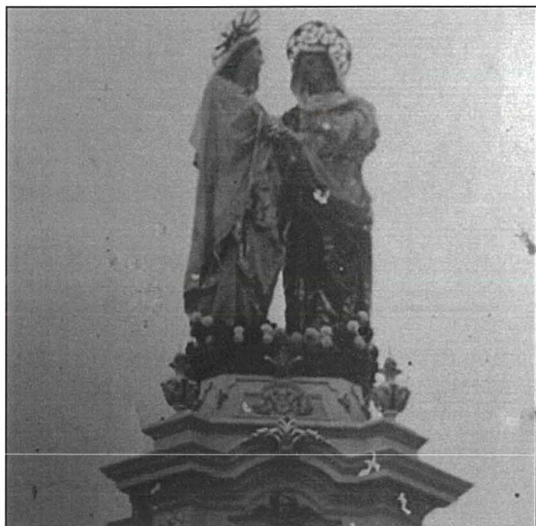
Figura 4. Dettall tal-parti ta' fuq tal-pedestall