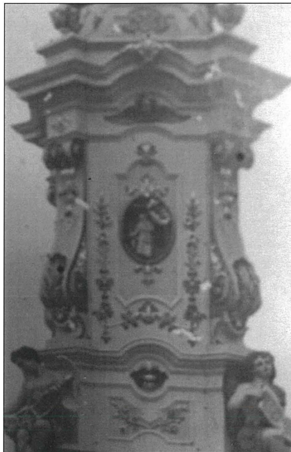
Figura 3. Dettall tal-parti tan-nofs tal-pedestall turi lill-anġlu jidher lil Żakkarija