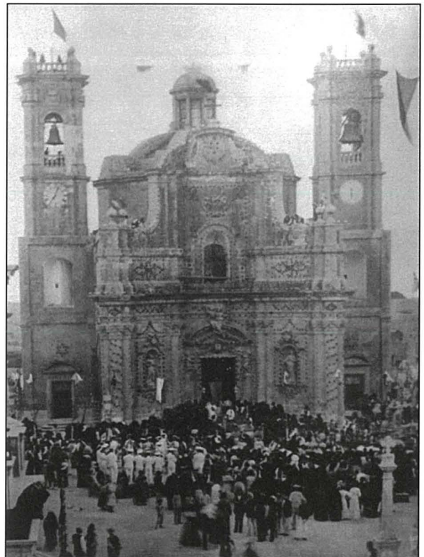
Figura 1. Il-faċċata tal-knisja mżejna u l-Banda Leone tal-Belt Vittorja fuq il-plancier fil-bidu tas-seklu għoxrin.