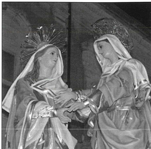
Figura 5. L-Istatwa tal-Viżitazzjoni maħduma minn Wistin Camilleri

Fis-sena 1929 l-Professor Luigi Billion kiteb l-innu bit-Taljan biex jitkanta lejlet il-festa u nharha xħin tkun ser toħroġ il-purċissjoni. Il-mużika kienet miktuba mill-Kavallier Cardenio Botti, tal-Banda 'La Vallette' tal-Belt u ndaqq għall-ewwel darba fil-festa tal-1930 mill-Banda 'La Stella' tar-Rabat Għawdex.