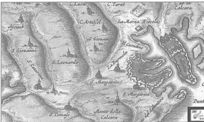
Mappa tas-seklu 17 li tagħmel referenza għal knisja ta' San Leonardo fil-limiti taż-Żejtun

kienet ġiet iddekonsagrata fl-1615 u jsemmi li din il-knisja kienet tinsab fl-inħawi magħrufa bħala "Tal-Qassasa ta' Buleben".