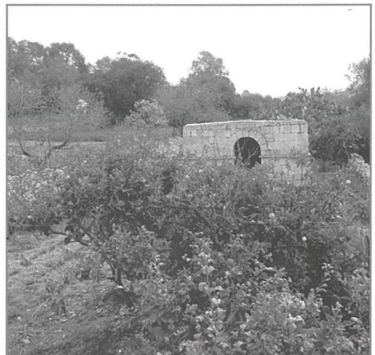
L-istruttura rurali, possibilmnt parti mill-knisja medjevali ta' San Leonardu mill-faċċata u minn wara