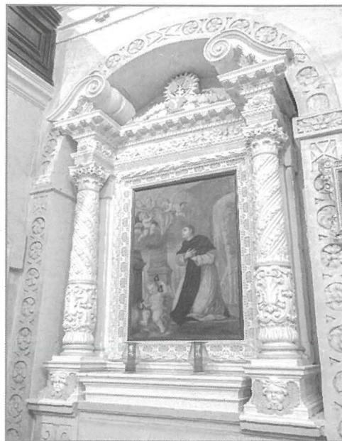
L-altar ta' San Anard