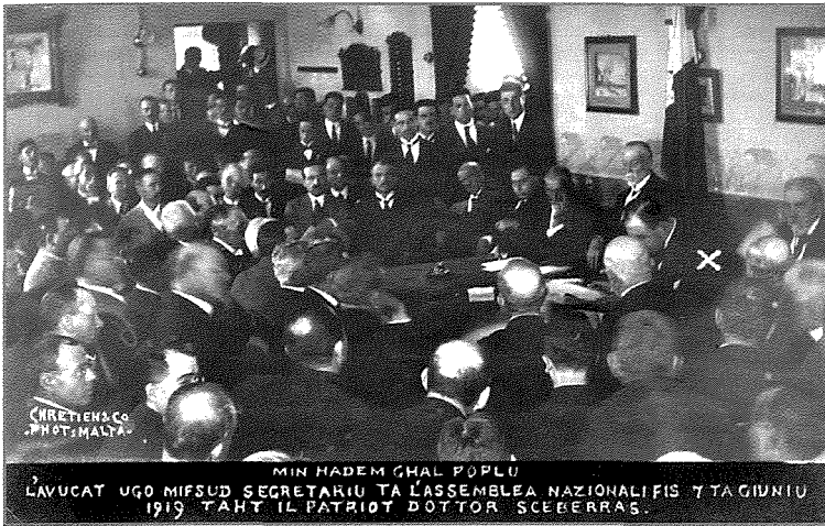
Il-laqgħa tal-Assemblea Nazzjonale, 7 ta' Ġunju 1919

Intant waqgħu fil-mira ta' dawk li nġabru l-Belt diversi binjiet li għall-Maltin kienu marbuta mal-oppresjoni Ingliża u ma' dawk li kienu kkunsidrati li bieġħu ruħhom lill-Ingliżi fil-kontroll tal-prezz tal-qamħ, hekk kif huma stagħnew minn fuq il-foqra. L-ewwel binja li giet attakkata kienet il-ħanut A La Ville de Londres , li kellu bandiera Ingliża fuq dik Maltija, wara kien imiss il- Union