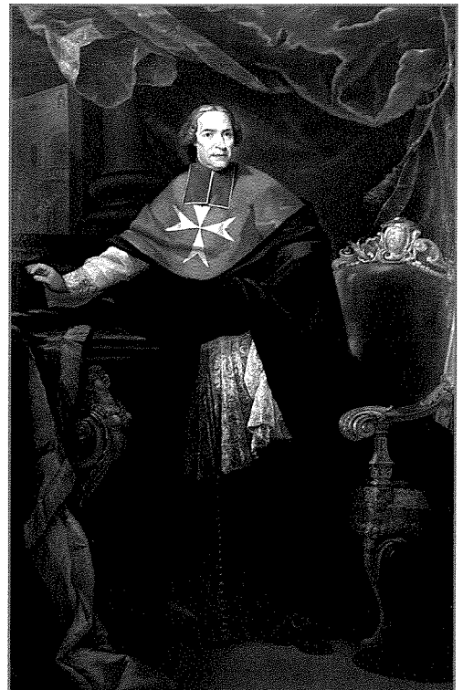
Attribwit lil Francesco Zahra, L-Isqof Paolo Alpheran de Bussan, żejt fuq tila, Palazz tal-Isqof, Valletta

Imbagħad, fis-seklu ta' wara, fis-16 ta' Diċembru, 1817, kiteb lill-isqof bit-Taljan f'sitt folji Franġisku Cassar, Prokuratur tal-Knisja ta' Ħal Kirkop,