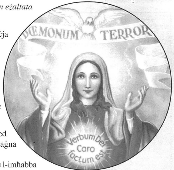
Il-pittura tal-Madonna minn Raphael Bonnici Cali