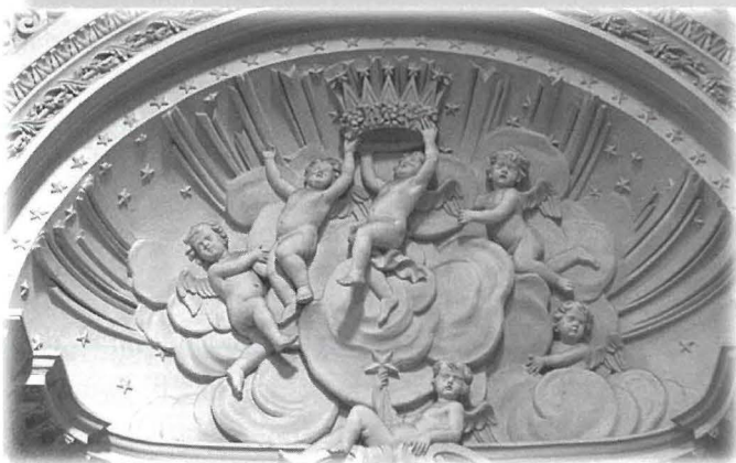
Detalji tal-iskultura tal-artali tal-Agunija u tal-Kuncizzjoni fil-Knisja l-Qadima

jieħu l-qisien għall-kwadru li kellu jakkumpanja l-Kurċifiss u li dan kien tqiegħed f'postu f'Jannar tas-sena ta' wara. 16 Madankollu fil-kwadru preżenti hemm id-data 1779 taħt riġel il-figura ta' San Ġwann, meta hu magħruf li Francesco Zahra miet fis-sena 1773.