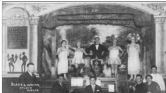
Artisti e musicisti di uno spettacolo tipico in un rispettabile Music Hall a Strada Stretta.

si schiantò contro il Camperdown (un’altra nave inglese). Andò velocemente a picco portando con sé 358 membri dell’equipaggio. L’investigazione ufficiale del tragico incidente navale ebbe luogo a Malta.