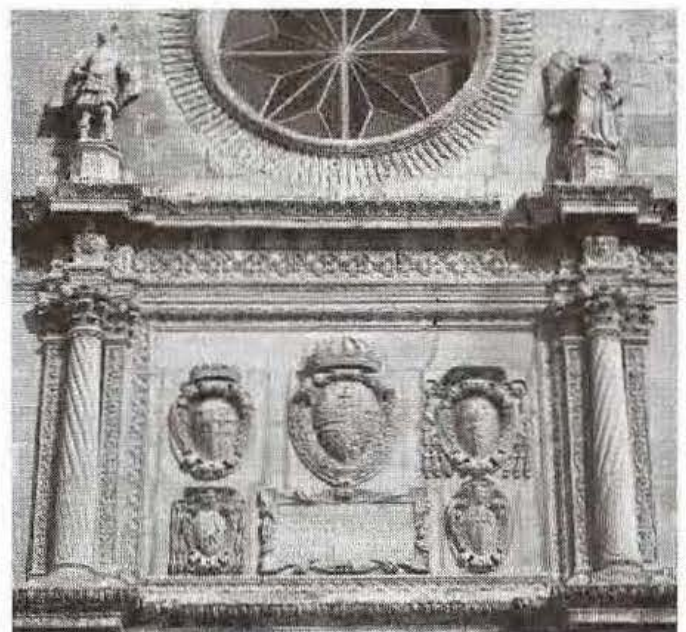
L-iskultura li hemm fuq il-bieb prinċipali tal-Knisja