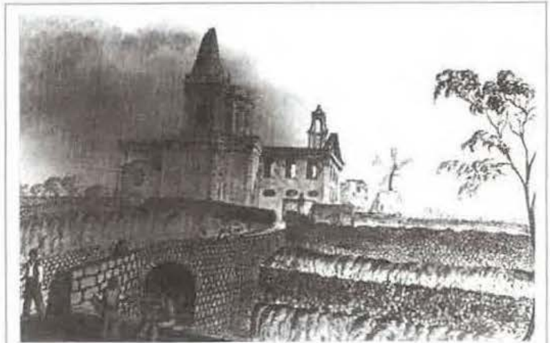
Il-wied ta' B'kara bil-Knisja l-Qadima fuq wara - bidu tas-seklu 19

L-ewwel parroċċa, jew ahjar cappella (2), ta' Santa Elena / Santa Marija ta' Birkirkara kienet tinsab fl-inhawi maghrufa bhala ta' l-Gharghar, limiti ta' Birkirkara, u probabl li kienet inbniet fil-bidunett tas-Seklu 15, minhabba l-kobor tal-popolazzjoni ta' Birkirkara (madwar 500). Fil-fatt kien hemm 89 raġel li kienu jiehdu sehem fid-Dejma bejn is-snin 1419 / 1420. Jidher ukoll f'hafna dokumenti li hemm ftit tal-konfużjoni meta tissemma lil min kienet