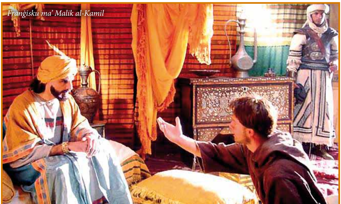
Franġisku ma' Malik al-Kamil