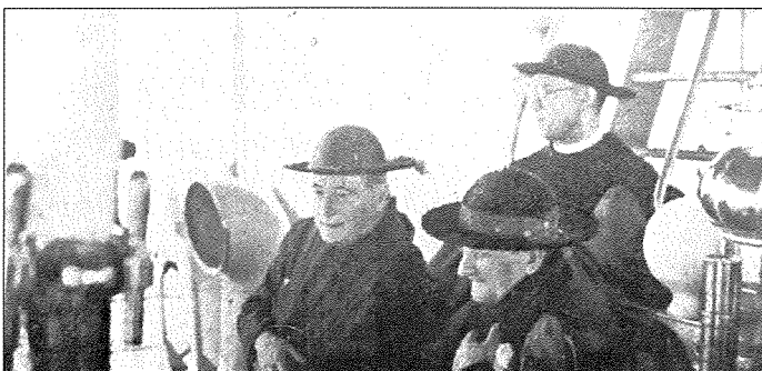
Fig 3. Il-Kardinal Lepicier fuq id-destroyer Wren sejjer lejn Għawdex

Il-Kardinal Lepicier laqqa' il-Kunsill Reġjonali mill-Ħadd 9 ta' Ġunju sal-Ħadd ta' wara. Nhar it-Tlieta 18 ta' Ġunju fis-6.30 ta' filgħaxija l-Kardinal Legat wasal l-Mgarr Għawdex fuq id-destroyer tan-Navy Ingliża 'Wren' akkumpanjat mill-Arcisqof Mauro Caruana, L-Isqof t'Għawdex Mikiel Gonzi u membri oħra tad-delegazzjoni pontifiċja (Fig 3).