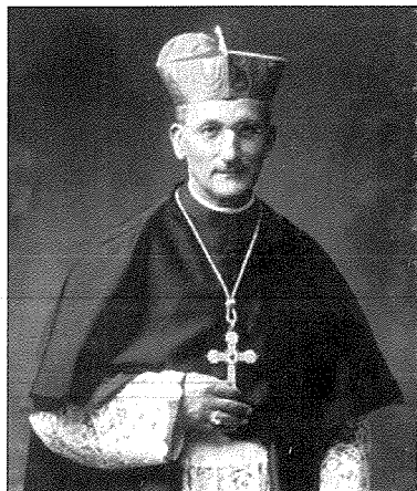
Fig 1. Il-Kardinal Alessju Enriku Marija Lepicier

Sentejn qabel kien jaħbat għeluq il-50 sena minn meta Karmela Grima kienet semgħet lehen il-Madonna jsejħilha mill-kappella ddedikata lit-Tluġh is-Sema ta' Marija jew kif hi magħrufa l-Madonna ta' Pinu. Fis-6 ta' Frar tal-1933 ftit xhur wara li dan it-tempju kien ingħata t-titlu ta' Bażilika mill-Papa Piju XI, l-Isqof t'Għawdex Monsinjur Mikiel Gonzi kiteb lill-Kardinal Ewġenju Pacelli, l-Arċipriet tal-Bażilika tal-Vatikan biex il-Kapitlu ta' San Pietru jagħti l-permess sabiex ix-xbieha tal-Madonna ta' Pinu tiġi nkurunata 8 .