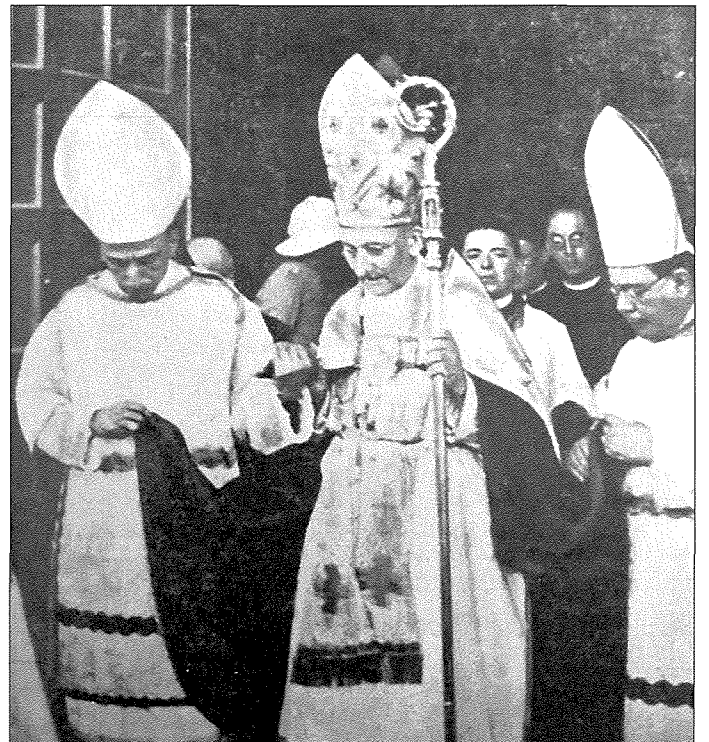
Fig 5. Il-Legat tal-Papa ħiereġ mil-bażilika ta' Pinu

Daqqew il-qniepen tas-santwarju u tal-knejjes t' Għawdex kollu u ġew sparati salut wara l-ieħor. L-Isqof Gonzi li ra ħolma tiegħu ssir realtà għamel diskors qasir fejn spjega s-sinifikat ta' din iċ-ċerimonja. "Ferħ kbir qiegħed jimlieli qalbi tant illi ma nistax insib kliem biex infissru" qal l-isqof imqanqal ..... "nesprimi sens ta' ringrazzjament lil Alla fuq kolloxx li wara li tana il-grazzja li naraw dan is-santwarju mgholli għad-dinjita ta' Bażilika issa tana x-xorti wkoll naraw l-inkurunazzjoni tal-għażiża Omm Alla bid-deheb tal-irġiel u n-nisa tagħkom bħala sinjal ta' qima lejn il-Madonna. U intom ġejtu minn kullimkien