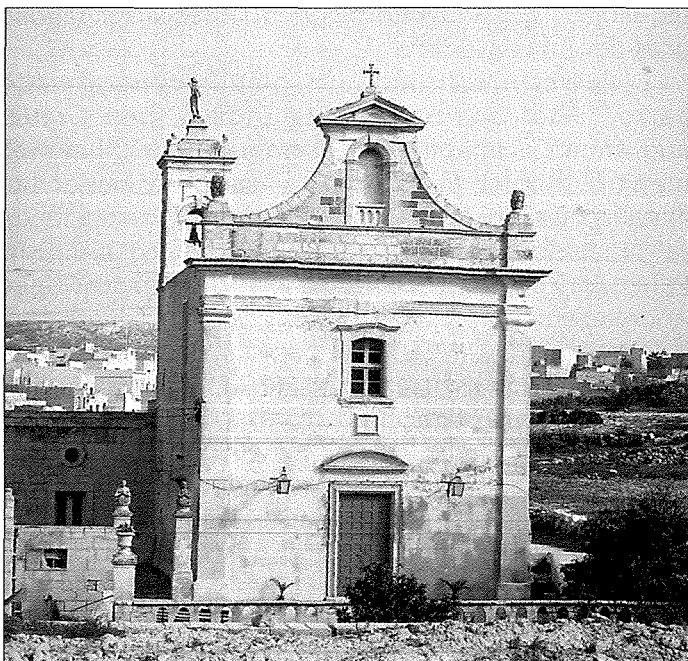
Figura 3: L-ewwel knisja Parrokjali tal-Għarb imsejja taż-Żejt

Il-knisja tal-Virtut jew taż-Żejt iddedikata lill-Viżitazzjoni ta' Marija lil Elizabetta kienet ikkundanata fl-24 ta' Mejju 1657 minn Mons M.G. Balaguer 18 u n-nies tal-Għarb rranġawha kif setgħu 19 . Madankollu meta il-Vigarju Ġenerali Monsinjur Bologna żarha fl-1663 xorta ma sabhiex f'kundizzjoni tajba u ordna li terġa tinbena mil-ġdid 20 . Meta L-Isqof Luca Bueno għamel il-vista tiegħu fl-1667 sab il-knisja mgħammra b'lampier li kien jixgħel kuljum u lil Bastjan Grima li kien jiehu ħsieb il-knisja, nġhatatlu s-somma ta' 6 skudi biex bl-imgħax tagħhom ikun jista' jhallas għal quddies kantata nhar il-festa tal-Viżitazzjoni fit-2 ta' Lulju 20,21 . Il-knisja taż-Żejt reġgħet inbniet mil-1675 sal-1678 u din id-darba il-knisja tkabbret sew bil-għajnuna tal-benefattrici Domenicuzza Mifsud Piscopo li tat biżżejjed art biex titkabbar il-knisja, jinbena zuntier quddiemha u