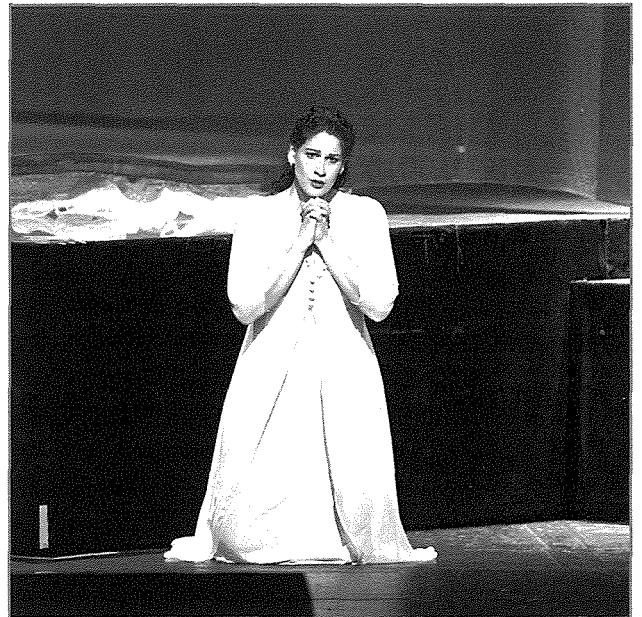
L'Ave Maria mill-Otello (Vienna Staatsoper, 2013)

Element importanti fl-istorja huwa kuruna tar-rużarju. Din il-kuruna tar-rużarju tibqa' titfaċċa matul l-opra kollha, u saħansitra ssalva ħajjet waħda mill-karattri. Lejn l-aħħar tal-opra nsibu xena fejn La Gioconda (il-karattru prinċipali tal-opra), sabiex teħles lil ħabibitha mill-mewt taċċetta l-avvanzi ta' ċertu Barnaba, raġel li hi tistmerr. Tant hija tistmerru