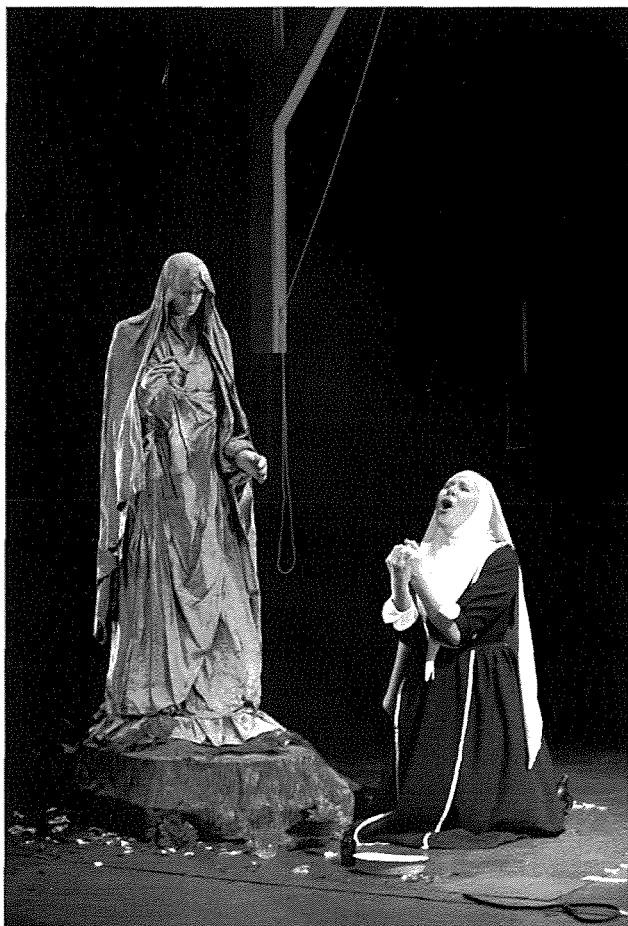
Suor Angelica (Birmingham Conservatoire, 2012)

Eżatt wara La Bohème , Puccini kiteb Tosca (1900), opra fejn l-element religjuż kien wiehed iktar qawwi minn qatt qabel. L-ewwel att kollu jseħħ fi knisja, u t- Te Deum li jagħlaq l-ewwel att huwa kapulavur fih inniffsu. Fit-tieni att insibu lil Tosca titlob lil Alla f'mument diffiċli permezz tal-arja ċelebri 'Vissi d'arte'. Hawnhekk ukoll insibu mument ta' devozzjoni Marjana, minkejja t-ton ta' disperazzjoni tagħha. Tosca , li kienet kantanta ċelebri, offriet leħinha lil Alla u b'ġidha sebbhet il-mant ta' Marija. Issa fil-mument ta' krizi qed titlob l-għajnunha.