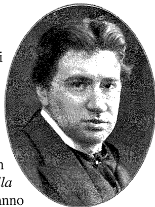
Ermanno Wolf Ferrari

Forsi kien xieraq li ngħalaq b'Puccini, l-aħħar ġgant tal-opra Taljana, però hemm xogħol ieħor mhux magħruf fejn il-kult tal-Madonna jieħu post iktar ċentrali. Din l-opra hi I Gioelli della Madonna (1911) ta' Ermanno Wolf-Ferrari (1876 -