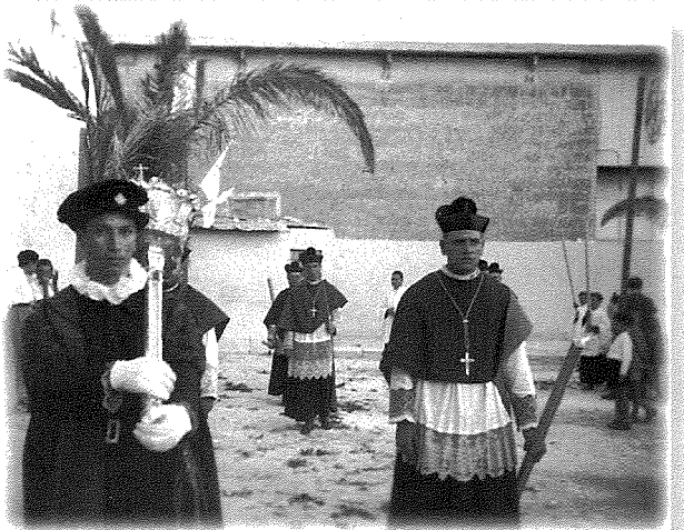
(Il-mazzier ippreċedi l-Kapitlu Elenjan fil-festa ta' Marija Awżiljatriċi fl-Oratorju – snin 30 – 40 tas-seklu li għadda)