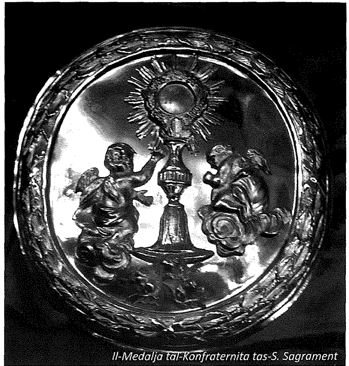
Il-Medalja tal-Konfraternita tas-S. Sagrament

Fl-1801, l-Arcipriet Dun Ġwann Xuereb, il-kapitlu tal-kollegġjata, l-kleru u l-poplu tal-Għarb għamlu talba lill-Isqof Vincenzo Labini sabiex titwaqqaf il-Konfraternita tal-Madonna tal-Konsolazzjoni jew taċ-Ċintura. Fit-23 ta' Novembru tal-1801 l-Isqof inkariga lill-Arcipriet tal-Birgu Dun Ġovanni Battista Delia biex jistudja t-talba u jifli l-istatuti u l-obbligi kollha li kellhom jħarsu u jagħtih parir għandux japprova din l-kongregazzjoni. Sitt ijiem