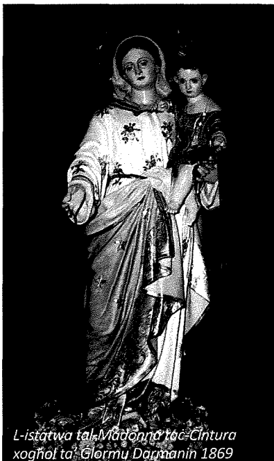
L-istatwa tal-Madonna taċ-Ċintura xogħol ta' Ġlormu Darmanin 1869

Il-membri tal-kongregazzjoni taċ-Ċintura kellhom id-dmir li jattendu purċissjoni li kienet issir fir-raba' t'add ta' kull xahar wara l-kompieta. L-Arcipriet li kien ir-rettur ta' din il-kongregazzjoni jew xi hadd li jqabba hu minfloku kien jagħmel priedka f'din l-okkażjoni sabiex iħeggeġ in-nies għad-devozzjoni lejha il-Madonna taċ-Ċintura. L-imsieħba ta' din il-kongregazzjoni kienu obligati jagħmlu ġurnata sawm nhar is-Sibt ta' wara li jkun miet membru tal-għaqda u jekk ma jkunux jifilhu jsumu kellhom jgħidu ħmistax il-posta rużarju. Kellhom ukoll jattendu l-funeral u jgħidu ħames posti rużarju għal ruħu fil-kappella tal-