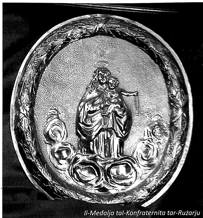
Il-Medalja tal-Konfraternita tar-Rużarju