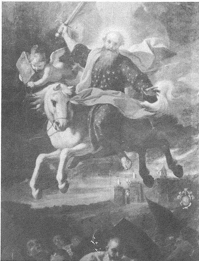
Pittura li tinsab fil-Kattidral ta' l-Imdina, xogħol tal-pittur Mattia Preti (1613-1699) li turi l-istess dehra u li fiha San Pawl jidher liebes libsa blu bl-istilel. Fil-bogħod tidher l-Imdina b'xi bandieri bojod u ħomor w oħrajn b'emblema fuqhom.

Fis-Sagristija tal-Kollegġjata ta' San Pawl fir-Rabat insibu wkoll din il-ġrajja impittra f'affresk fil-lunetta li hemm fuq il-bieb li mis-Sagristija jagħti għall-kappellun ta' Sant' Anton. Dan l-affresk qiegħed fi stat ħażin ħafna u għandu bżonn