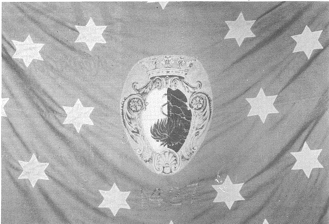
Il-Bandiera li dwarha qed jinkiteb dan l-artiklu.

B'dan kollu l-Maltin kienu ferm ħenjin u kburin iżda l-kbir kien għadu ġej. Mill-kitba tal-kronista Għarbi El-Zarkasi nafu li f'Settembru tas-sena 1429 armata ta' 18,000 ruħ mibgħuta minn Tunes, taħt il-kmand ta' Kajd Ridavan, ħebbet għal Malta u Għawdex għall-għarrieda. Il-Maltin għalkemm sofrew xebgħa kbira ma ċedewx. Ridavan qatel ħafna nies u ġarr għadd ġmielu ieħor fl-eżilju. Iżda jitqies b'miraklu li Malta ma nħatfitx. L-istess El-Zarkasi jkteb li l-Misilmin telqu lura fil-mument li kienu kważi ħadu 'l Malta taħt idejhom.