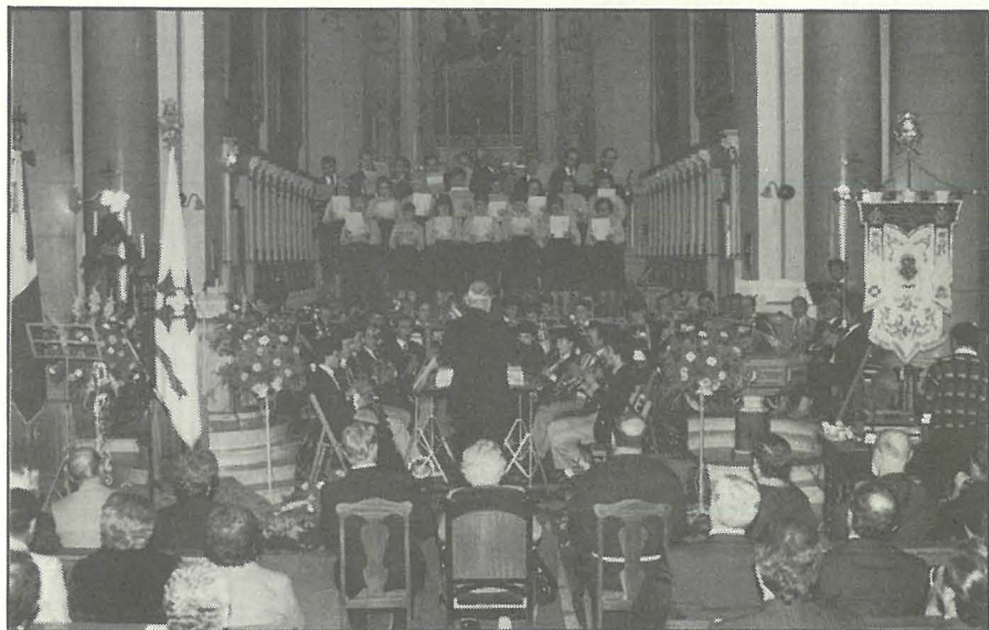
Il-Kor tal-Marsa qiegħed ikanta fl-Akkademja li kienet saret fil-Knisja tas-S.S.ma Trinità f'eghluq 1-40 sena tal-Banda "Holy Trinity".