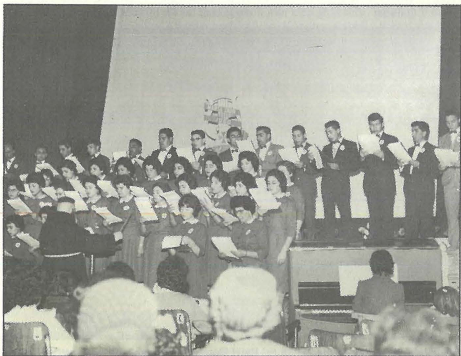
Il-Kor tal-Marsa jkanta fil-Jhansi Hall fl-1960 fl-okkażjoni tal-Festa tal-Ġenituri.