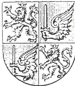
Manuel de Vilhena