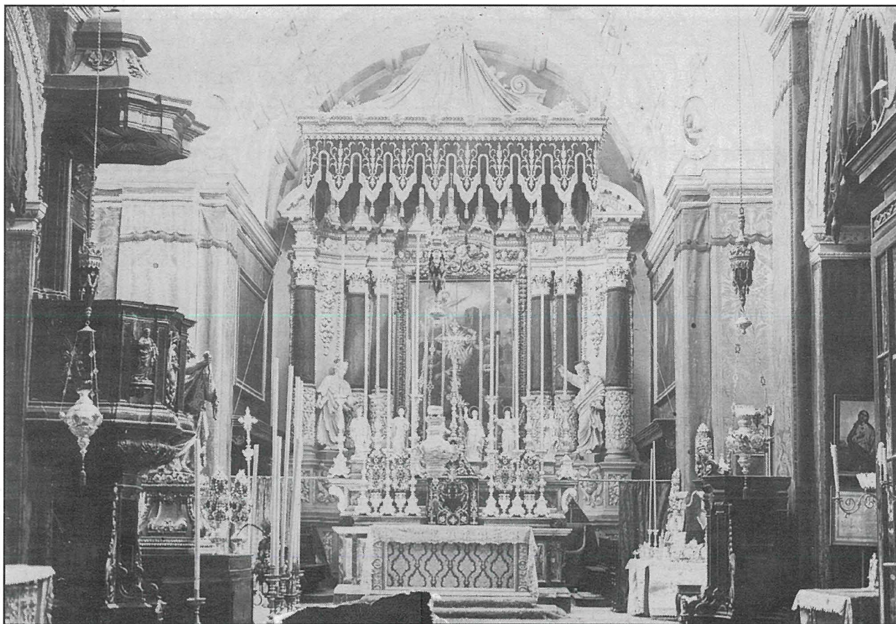
Ritratt antik ċirka 1950