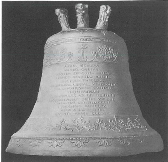
Il-Qanpiena l-Kbira 'Helena'

Huwa mifhum li l-armor biex titniżżel il-qanpiena l-antika mill-kampnar dam għaddej f'it iżjed minn xahar. Imbagħad, f'wieħed