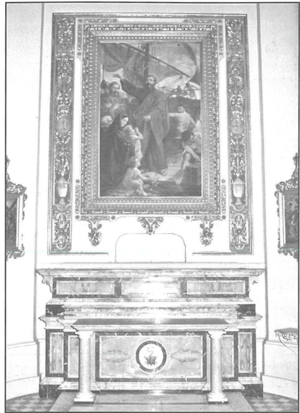
L-Artal ta' San Pawl

barokka. Iċ-ċentru tagħha huwa mdawwar bis-sħab b'raġġi herġin minnhom u b'sitt irjus ta' angli maż-żbul u l-għeneb li huma s-simbolu tal-Ewkaristija. Fil-parti t'isfel hemm id-data 1742 wara ras ta' angli li turi li hija qadima u għalhekk ingiebet minn x'imkien ieħor. Id-disinn u d-dekorazzjoni tagħha sar mis-Sur Ġuzeppi Decelis mill-Birgu.