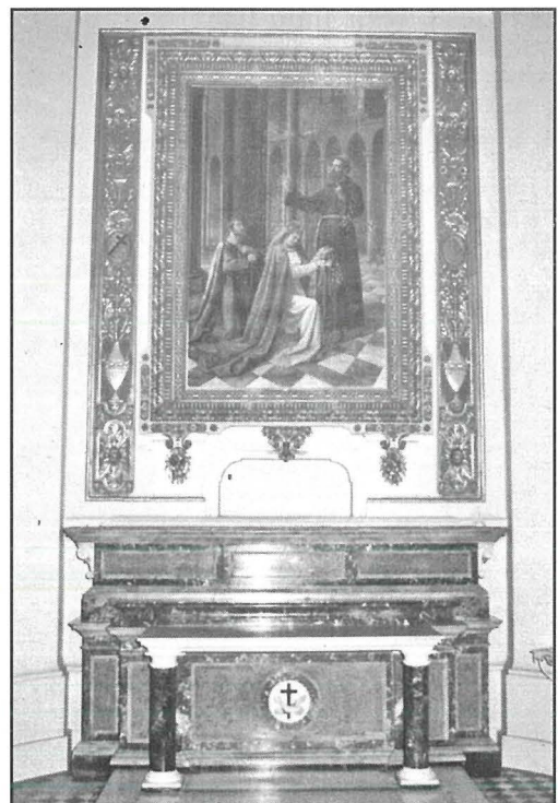
L-Artal ta' San Frangisk