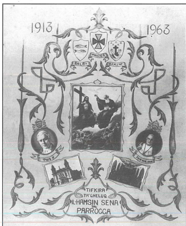
Id-Disinn originali tas-Santi l-kbar

Wiehed ma jistax ma jinnutax anki f'din is-santa kemm il-kuluri użati bl-aħdar turkważ, l-oranġjo u l-isfar holqu tassew kuntrast sabiħ mal-kumplement tal-armi u r-ritratti murija fiha. Hija tifkira li żgur tqanqal nostalgija kbira fost il-Marsin li jiftakru ż-żminijiet ta' dawk il-festi li kienu saru kif ukoll is-sens ta' devozzjoni lejn il-qofol tat-twemmin tagħna f'Alla wiehed fi Tliet Persuni.