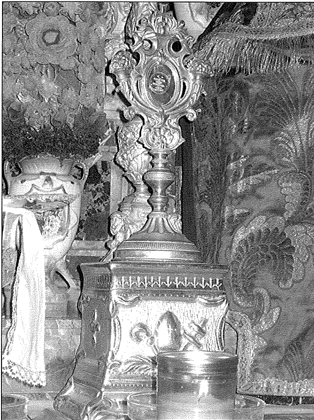
l-ostensorju bir-relikwija tal-qaddis armat fuq l-artal.

tal-Għarb kien ħalla miktub, qabel ma miet fit-13 ta' Diċembru 1844, li din il-knisja ta' San Publju jaqbel li tiġi mibnija taħt it-titlu tal-qaddis tiegħu u li jgħib ismu. Qala' wkoll il-permess tal-isqof ta' Malta, Mons. Publju Sant 3 , li ferah wisq li din il-knisja kienet se tkun iġġib l-isem ta' San Publju u li għalhekk b'hal-Arcipriet Refalo tkun iġġib ismu wkoll; imma żamm il-patt, li qatt ma sar fatt, li f'din il-knisja kellha titpoġġa xbieha