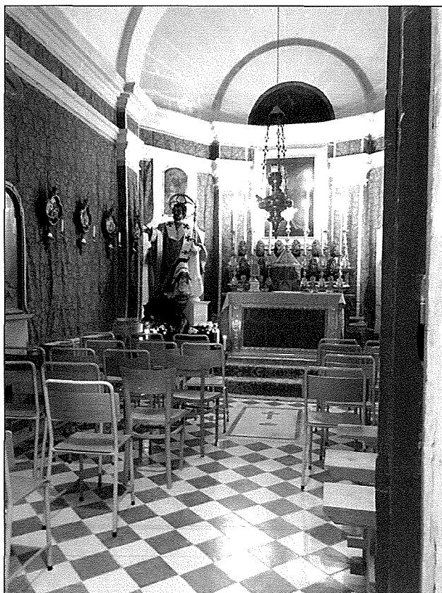
Il-Knisja armata għall-festa tal-2017. Tidher ukoll il-vara ta' San Publiju biswit l-artal