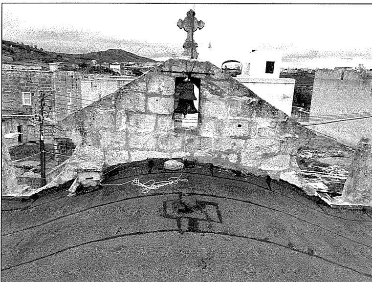
Il-bejt u l-kampnar tal-knisja li minn fuqu tidher veduta pittoreska ta' Għawdex.

tal-Għarb kien ħalla miktub, qabel ma miet fit-13 ta' Diċembru 1844, li din il-knisja ta' San Publju jaqbel li tiġi mibnija taħt it-titlu tal-qaddis tiegħu u li jgħib ismu. Qala' wkoll il-permess tal-isqof ta' Malta, Mons. Publju Sant 3 , li ferah wisq li din il-knisja kienet se tkun iġġib l-isem ta' San Publju u li għalhekk b'hal-Arcipriet Refalo tkun iġġib ismu wkoll; imma żamm il-patt, li qatt ma sar fatt, li f'din il-knisja kellha titpoġġa xbieha