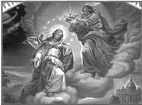
Dettal mix-xena tal-Inkurunazzjoni

Ftit tas-snin ilu, proprju fl-2008, il-Knisja kienet qed tinzebaħ u beda