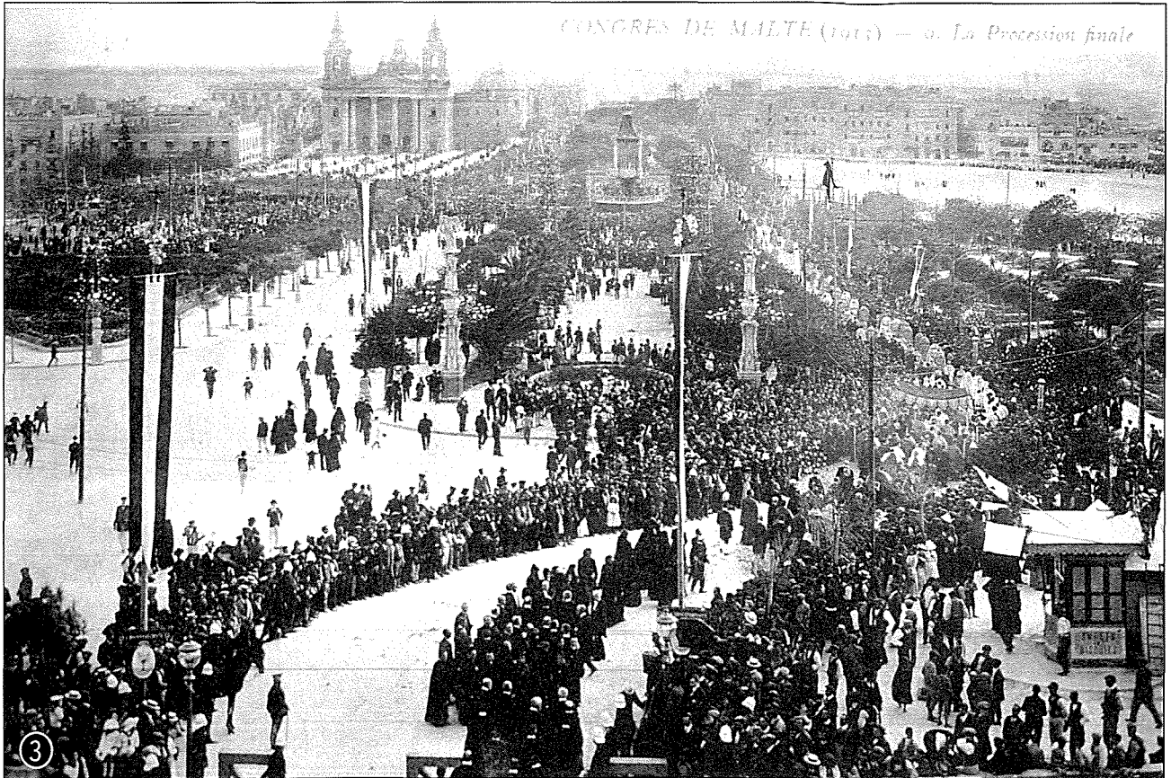
CONGRES DE MALTE (1911) — 9. La Procession finale