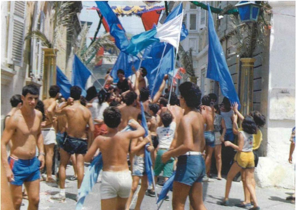
L-Ewwel Marc ta' Filghodu li daqqet fih il-Banda tagħna, il-Banda Eastern Star