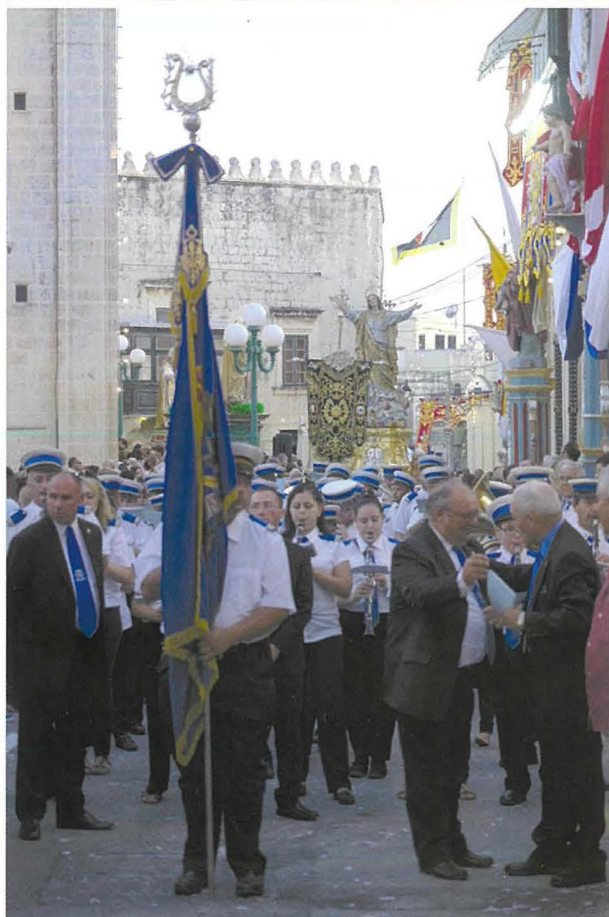
L-għan tas-Socjetà La Stella Levantina hu li jkabbar il-Festa ta' Santa Marija. Ritratt li juri l-Banda Santa Marija takkumpanja lill-Patruna waqt il-Purċissjoni