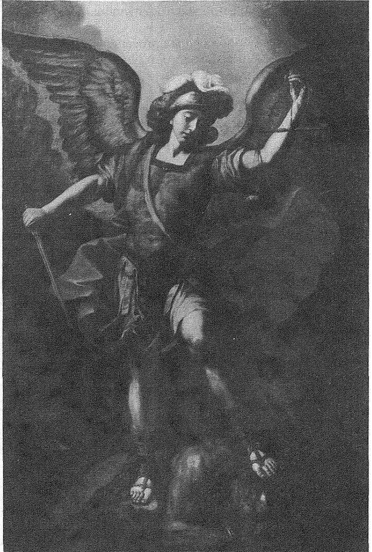
Pittura ta' San Mikiel xogħol ta' Mattia Preti fl-1690

Nafu li fil-5 t'Ottubru 1731 il-fratelli bagħtu jġibu mill-Belt Valletta statwa żgħira ta' San Mikiel biex