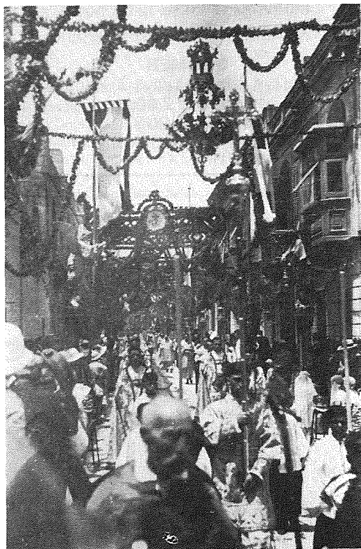
Il-purċissjoni ta' Corpus fil-għodu tal-1933 għadejja minn Strada Konti Ruġġieru.

Is-Sibt, lejliet il-Festa l-Banda Konti Ruġġieru għamlet Marċ Brijuz mat-toroq prinċipali tar-Rabat fis-siegħa ta' wara nofs in-nhar. Aktar tard fil-għaxija qabel ma ngħata l-logħob tan-nar ta' l-art saru Marċijiet Muzikali mill-Baned Duke of Connaught, Peace u La Vittoria.