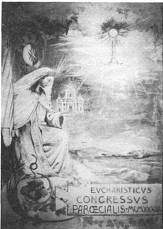
Il-pittura li saret biex tintrama fuq il-bieb ta' Sant' Anna fl-okkażjoni tal-Kungress.