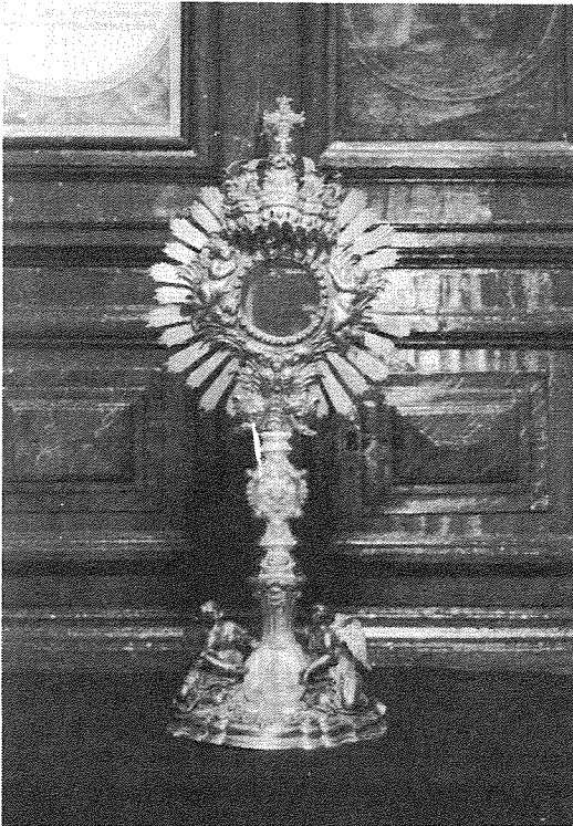
L-Isfera Barokka tal-Kulleġġ mogħtija mill-Gran Mastru Pinto f'Mejju 1747 xogħol ieħor ta' Gio. Andrea Troisi.

Minn-naħa l-oħra il-lampier ta' quddiem San Luqa ġie kummissjonat f'mistax il-sena wara fl-atti tan-nutar Baldassare Vitale u preċiżament fit-8 ta' Ġunju 1695 lill-argéntier Gan Battista Mamo, bin Simone, mill-Belt,