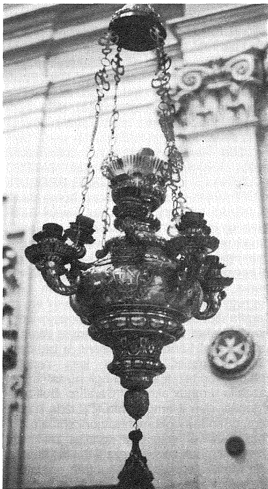
Il-Lampier il-Kbir ta' San Publiju ordnat fl-1680 u maħdum mill-Argentier Dionisio Famucelli

Opra oħra żgħira imma sabiħa hija l-bieba tal-fidda tat-tabernaklu ta' l-altar il-qadim li illum jinsab fil-kappellun ta' San Stiefnu, altar magħmul minn irħamijiet l-aktar