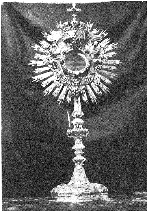
L-Isfera Barokka li toħroġ fil-Purċissjoni ta' Corpus. Din inħadmet mill-Arġintier Andrea Troisi fl-1754.

Drabi oħra ktibt fuq opri ta' pitturi, skultura, rħam eċc.; illum se nsemmi xi opri maħduma mill-fidda, li forsi mhux daqshekk faċli li wieħed japprezzahom. Mhux qed nitkellem minn opri kbar u pjuttost reċenti bħal ġilandra u l-ventaltar ta' Corpus, kif ukoll il-mazza