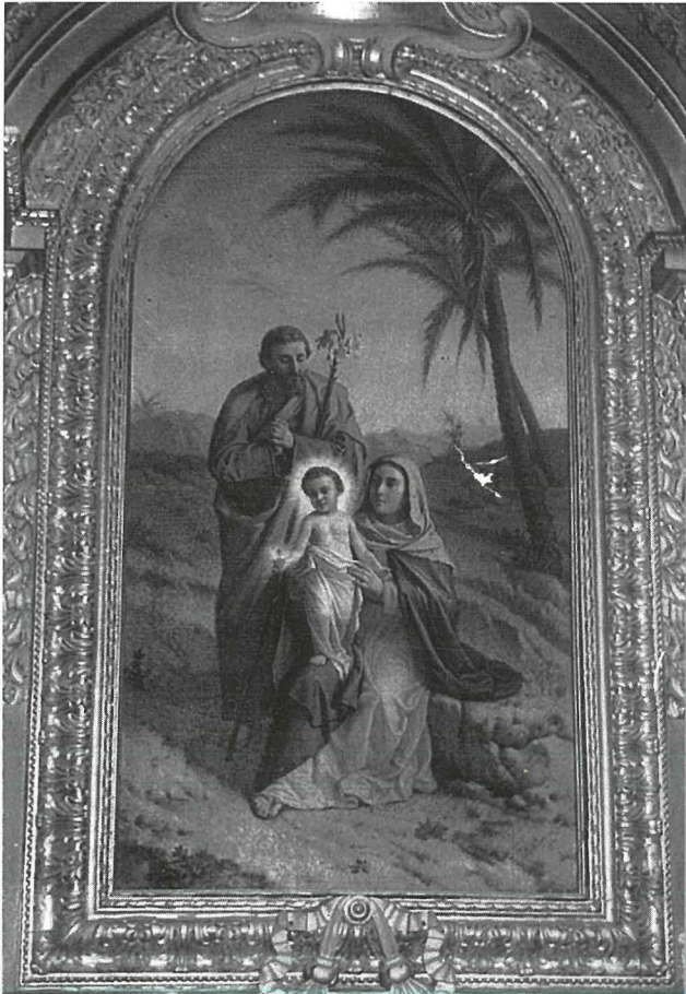
Il-Kwadru tas-Sagra Familja li hemm fuq l-altar fil-Knisja Arċipretali

Wieħed minn dawn l-altari fil-Knisja Arċipretali huwa ddedikat lis-Sagra Familja. Il-kwadru li hemm fuq dan l-altar huwa xogħol tal-artist Lazzaro Pisani.