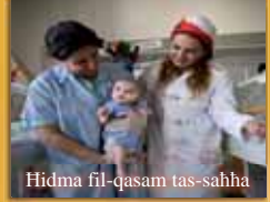
Hidma fil-qasam tas-sahha