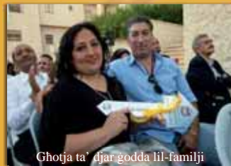
Ghotja ta' djar godda lil-familji

Int ukoll tista' tghin lill-Missjoni tal-Art Imqaddsa.