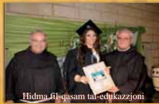
Hidma fil-qasam tal-edukazzjoni