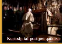
Kustodji tal-postijiet qaddisa